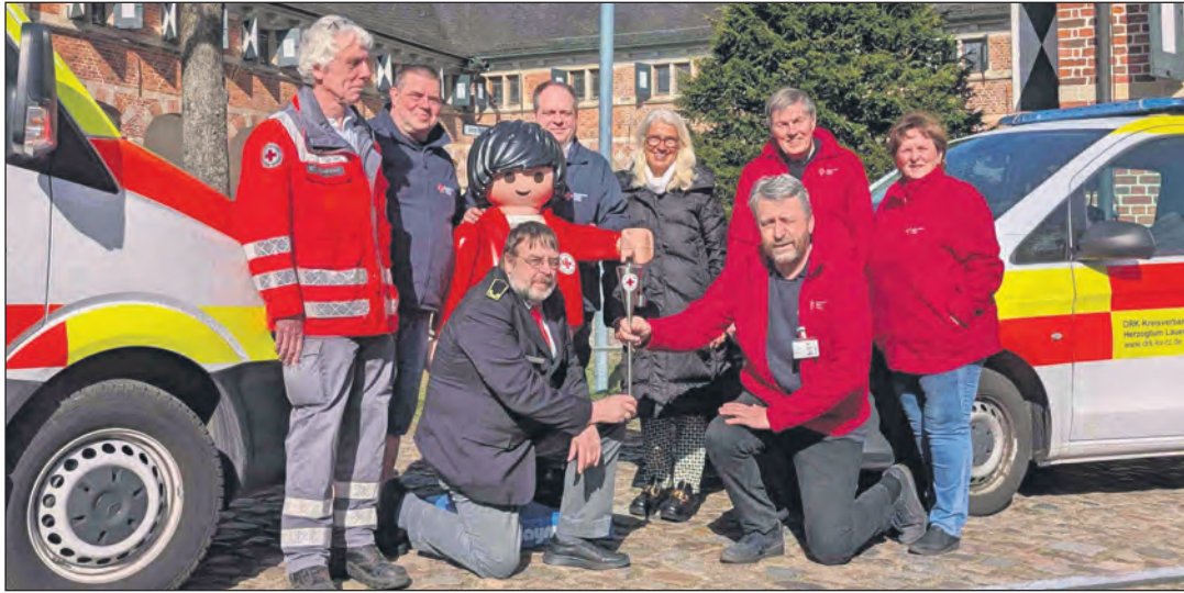
Mitglieder des DRK-Kreisverbandes Stormarn und des DRK-Kreisverbandes Herzogtum-Lauenburg sowie Maskottchen Henri bei der Fackelübergabe vor dem Reinbeker Schloss

DRK-Ortsverein Reinbek übernimmt die Fackel und schickt sie auf die Weiterreise