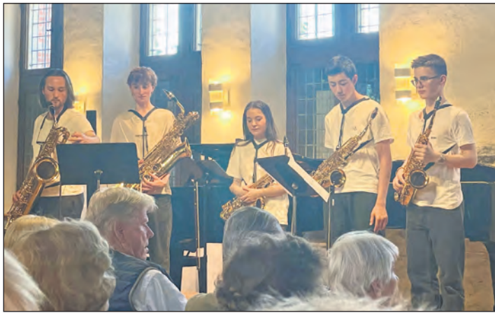
Das »Jugend musiziert“-Konzert von 2025