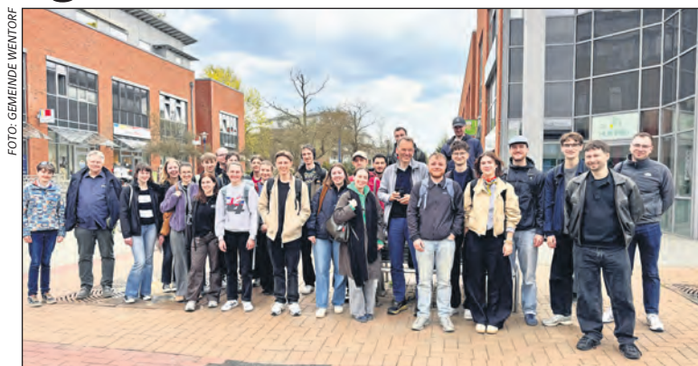
Fachdienst Bauen & Planen mit Studenten und Studentinnen der TH Lübeck

Am Donnerstag, 16.4.2026 hat im Rathaus ein erstes Treffen mit den beteiligten Studierenden stattgefunden. In diesem Rahmen wurden die Gemeinde vorgestellt und zentrale Themenbereiche erläutert.