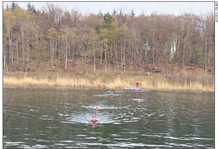
Für den DLRG-Nachwuchs hieß es am 12. April am Tonteich »Anschwimmen« bei gerade mal 12 Grad Wassertemperatur

Vorab wurden sie in zwei Gruppen über die Einsätze am Tonteich unterrichtet, erhielten eine Einweisung in die Gebäude und das Gelände und bekamen Infos zum Schutzkonzept und zur Gewaltprävention. Wie rufe ich im Notfall den Rettungswagen?