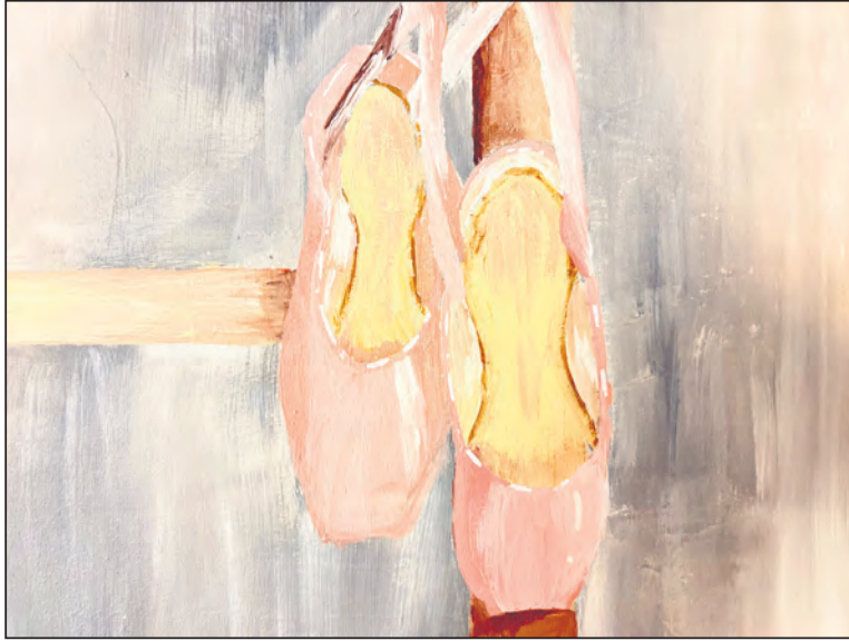
Ein Bild von der ehemaligen Tänzerin und Künstlerin Ruby Somann

Kartenvorbestellung unter ☎ 040-79419960 und info@tanz-wentorf.de Oder direkt an der Abendkasse 30 Min. vor Showbeginn im Zeighaus. Eintritt € 15,-, Kinder bis 12 Jahre zahlen € 12,-.