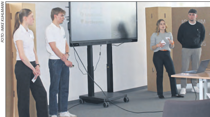
Das Team Prime Watch bei der Präsentation der Notrufuhr

Dass dieses Konzept aufgeht, zeigte sich schnell. In nur vier Stunden entwickelten die Teams beeindruckend ausgearbeitete Geschäftsmodelle. Themenschwerpunkt waren Uhren mit besonderen Funktionen. Eine Gruppe präsentierte etwa eine Smartwatch, die gezielt gegen Stress durch permanente Erreichbarkeit wirken soll. Das Produkt verzichtet bewusst auf klassische Benachrichtigungen und setzt stattdessen auf die Messung von Vitalwerten. Ziel sei es, digitale