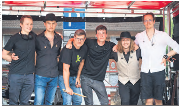
Die Band »THE BUNSEN-BURNERS« sorgt in Reinbek für Stimmung

Reinbek – Am Freitag, 1. Mai, startet das diesjährige Maibaumfest der Freiwilligen Feuerwehr Reinbek. Um 10.30 Uhr wird die Maibaumkrone ohne musikalische Begleitung am Rosenplatz aufgehängt. Die weiteren Aktivitäten starten ab 12 Uhr auf